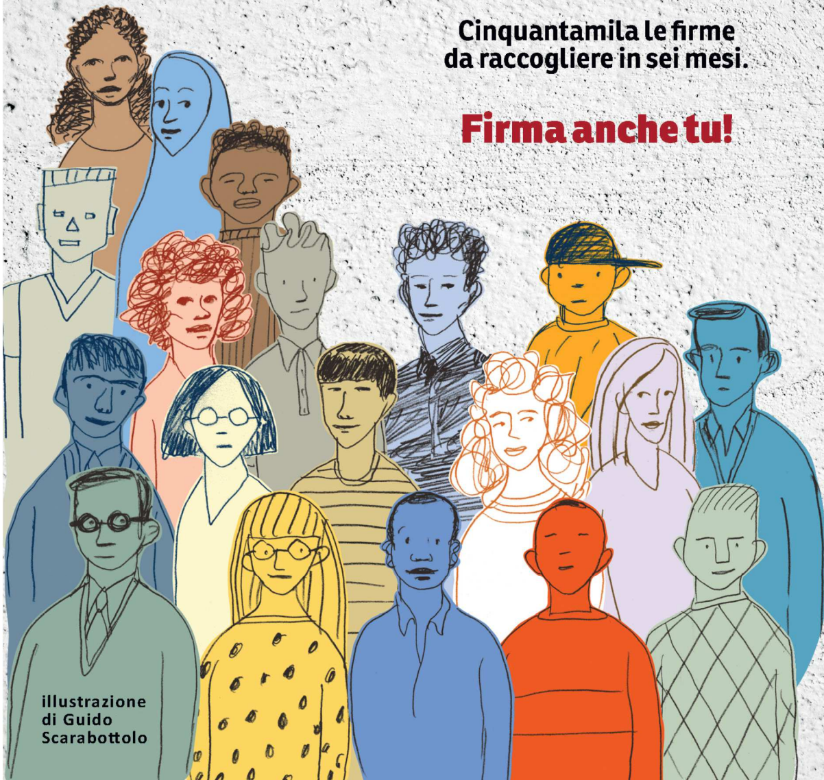
illustrazione di Guido Scarabottolo